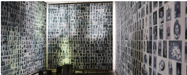
Le mur des enfants