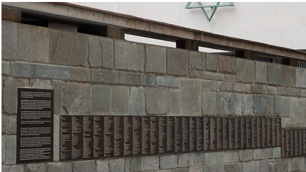
Le mur des justes

On les appelle les JUSTES. Les survivants des camps ont décidé de leur rendre hommage en leur donnant un diplôme lors de cérémonies officielles pendant lesquelles on les félicitait pour leurs bonnes actions, leur bravoure et leur détermination.